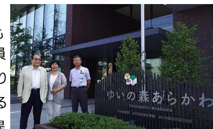
中央図書館をつくるための視察

板橋区議会では、「子どもの貧困対策調査特別委員会」を今年度から置き、より良い児童相談所を設置するための研究をし、板橋区に提